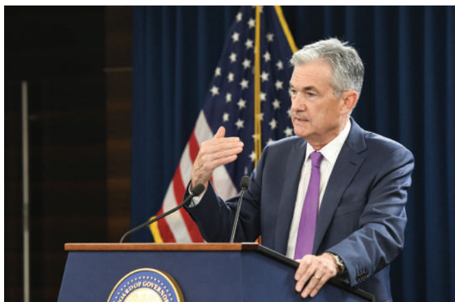
Jerome H. Powell

Στην κορυφή της πυραμίδας εξουσίας της Fed βρίσκεται ένα άτομο: ο πρόεδρος του Διοικητικού Συμβουλίου. Από τον Φεβρουάριο του 2018, αυτός είναι ο Jerome H. Powell, που συχνά αναφέρεται ως Jay Powell. Πώς απέκτησε ο Jay Powell αυτή τη θέση; Ο πρόεδρος διορίζεται από τον πρόεδρο των Ηνωμένων Πολιτειών και επιβεβαιώνεται από τη Γερουσία των ΗΠΑ για μια τετραετή θητεία που μπορεί να ανανεωθεί. Αυτό είναι όλο. Δεν υπάρχουν άλλες επίσημες προϋποθέσεις, ούτε νομική απαίτηση για εμπειρία στα χρηματοοικονομικά ή την οικονομία – αρκεί ο διορισμός από τον πρόεδρο και η επιβεβαίωση από τη Γερουσία. Αυτό δεν υπονοεί ότι ο Jay Powell δεν έχει κάποια κατάρτιση. Έχει περάσει το μεγαλύτερο μέρος της επαγγελματικής του καριέρας ως δικηγόρος και,