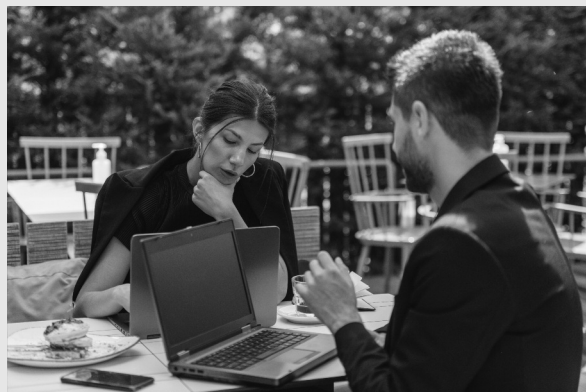
Περιγράφοντας τις ατέλειες του συστήματος.

«Μάρκο, δεν σου χτυπάω τίποτα. Πρέπει να οργανώσουμε καλύτερα τις βάσεις δεδομένων μας. Πεδία, εγγραφές, πίνακες, τα πάντα. Αυτό».