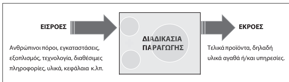
Σχήμα 1.1: Απεικόνιση ενός «τυπικού» παραγωγικού συστήματος

από υλικό αγαθό, προσφέρονται επίσης και υπηρεσίες αποκατάστασης των βλαβών, που ενδεχομένως θα συμβούν στη διάρκεια της εγγύησης καλής λειτουργίας ή και πρόσθετες δωρεάν υπηρεσίες τεχνικής υποστήριξης για ένα χρονικό διάστημα μετά την πώληση. Επομένως είναι σκόπιμο να διευκρινίσουμε ότι στα κείμενα, που ακολουθούν στη συνέχεια, ο όρος προϊόν (product), ως εκροή ενός παραγωγικού συστήματος, θα χρησιμοποιείται όταν αναφερόμαστε τόσο σε υλικά αγαθά (goods) όσο και σε υπηρεσίες (services) ή και σε συνδυασμούς που προσφέρονται αυτών των δύο.