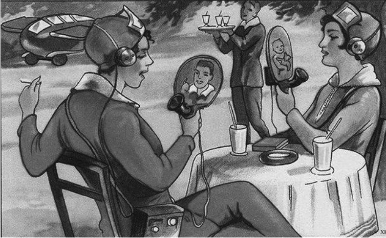
Πώς φαντάζονταν το μέλλον τη δεκαετία του 1930.

είναι ότι εγώ τείνω στο θετικό, ενώ εσύ έχεις αποφασίσει να μείνεις μόνιμα εκεί. Επιλέγω να τείνω κι όχι να μένω στο θετικό, για να έχω την απαραίτητη απόσταση. Το ίδιο ισχύει και για το αρνητικό. Είναι διαφορετικό να τείνεις στο αρνητικό απ' το να είσαι καθηλωμένος σ' αυτό. Η στοχαστική ματιά οφείλει να διατηρεί τις αποστάσεις απ' τα άκρα.