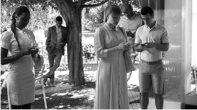
«Nosedive», Black Mirror .