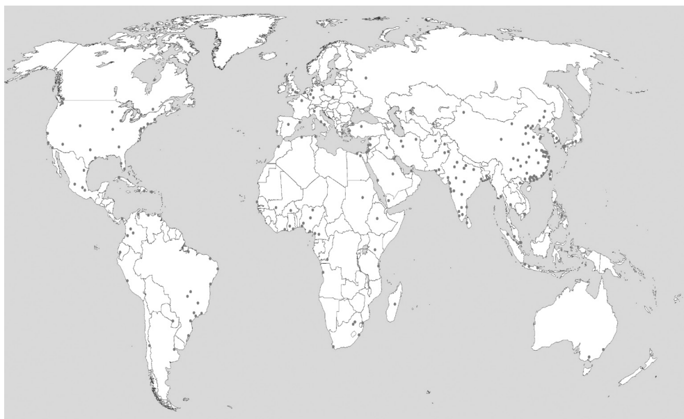
Εικόνα 2.1: Οι πόλεις με περισσότερους από 2.000.000 κατοίκους

Το φαινόμενο της αστικοποίησης συνδέεται με τις κοινωνικές και οικονομικές αλλαγές και εξελίξεις σε μια περιοχή, και η μελέτη του έχει ιδιαίτερο ενδιαφέρον για την ανάπτυξη αυτής της περιοχής, αλλά και της χώρας γενικότερα. Είναι ένα παγκόσμιο και διαχρονικό φαινόμενο, το οποίο επηρεάζει τόσο τις αναπτυγμένες, όσο και τις λιγότερο αναπτυγμένες ή τις αναπτυσσόμενες χώρες, ενώ συνήθως υπολογίζεται ως η ποσοστιαία αναλογία του αστικού επί του συνολικού πληθυσμού μιας περιοχής ή μιας χώρας. Ορισμένοι ερευνητές ορίζουν ως αστικοποίηση την αύξηση της έκτασης που καταλαμβάνει μια πόλη ή την αύξηση της έκτασης που χρησιμοποιείται για αστικές χρήσεις. Κάποιοι άλλοι ορίζουν την αστικοποίηση ως μια κοινωνική διαδικασία για την υιοθέτηση από τους κατοίκους ενός συνόλου στάσεων και συμπεριφορών που παραδοσιακά συνδέονται και χαρακτηρίζουν τους κατοίκους των μεγάλων πόλεων.