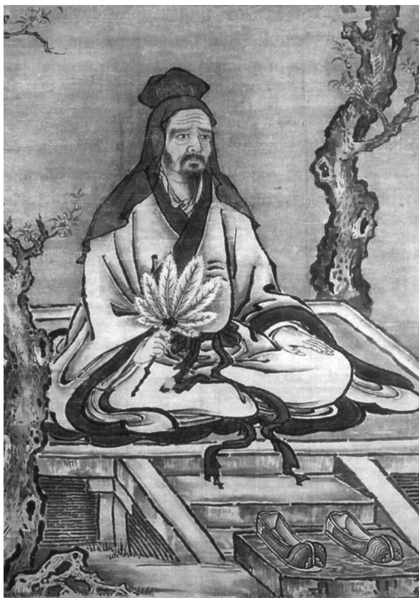
Εικόνα 1.1: Κομφοούκιος, 551-479 π.Χ.

Μέχρι πρόσφατα, η τυπική εκπαίδευση και η γραφή αποτελούσαν προνόμιο της ελίτ. Απέκτησαν τη σύγχρονη, καθολική, υποχρεωτική και μαζική μορφή τους μόλις τους δύο τελευταίους αιώνες στη Δύση και πολύ αργότερα, κατά τον 20ό αιώνα, στις αναπτυσσόμενες χώρες. Το συγκεκριμένο εκπαιδευτικό μοντέλο είναι πλέον οικείο σε ολόκληρο σχεδόν τον κόσμο. Όταν λοιπόν οι πολιτικοί δεσμεύονται ότι θα υποστηρίξουν την εκπαίδευση, εννοούν κατά κανόνα τη θεσμική, τυπική της διάσταση – τη δημιουργία νέων ή την επέκταση υφιστάμενων σχολείων και πανεπιστημίων, τη χρηματοδότηση των κτιριακών υποδομών τους, του προσωπικού τους και των προγραμμάτων σπουδών που προσφέρουν.